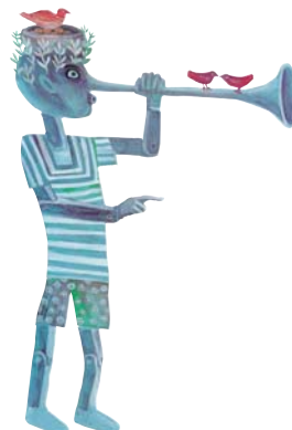
Immagine ideata da Stepan Zavrak per il 1° compleanno di Pinocchio 1988