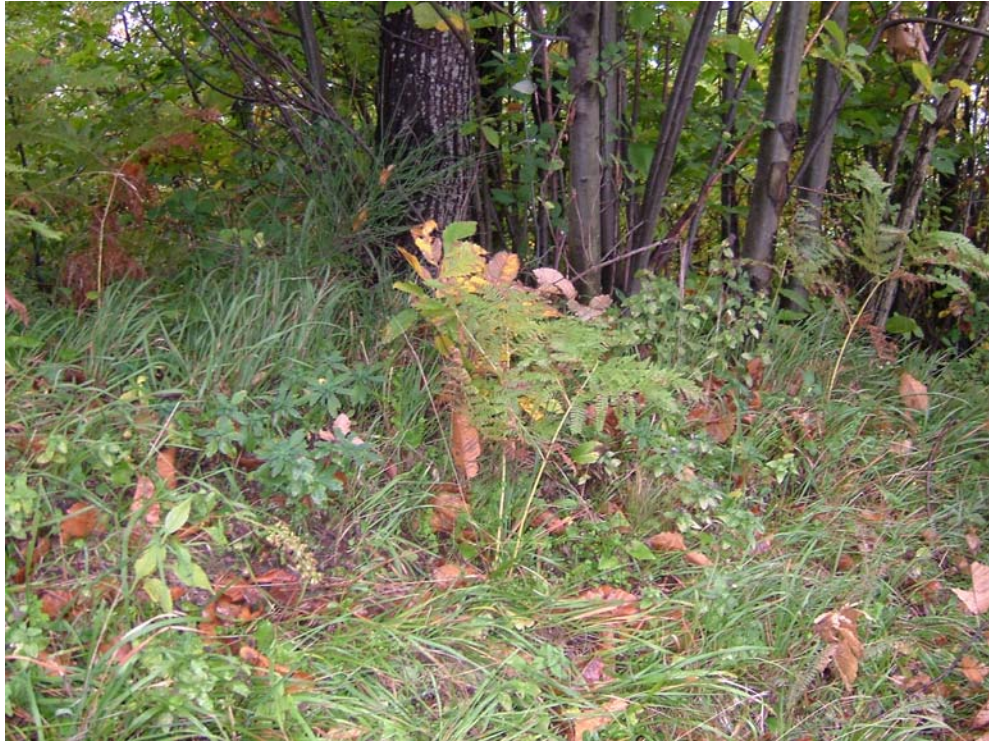
Il nostro sottobosco